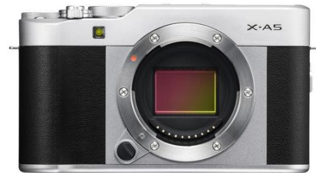
Kamera FujiFilm X-A5

Kamera yang digunakan untuk membuat karya fotografi seni ini adalah badan kamera ( camera body ) jenis digital Mirrorless . Kamera dengan sistem digital ini cara pengoperasiannya sama dengan kamera analog pada umumnya yang memakai film negatif. Perbedaan jenis kamera ini adalah bahwa tidak adanya prisma kaca yang ada di dalam badan kamera, sehingga setelah lensa langsung menuju ke sensor digital. Dan kamera jenis ini menjadi sangat ringan dan sangat praktis sebagai penunjang pembuatan karya ini. Jenis kamera yang digunakan