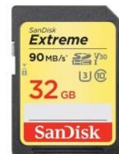
Kartu Memori SanDisk Extreme 32 GB