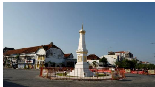
Foto ini diambil pada pukul 07.27 WIB. Di dalam frame jelas terlihat bahwa di ruas jalan menuju Malioboro ditutup. Dan disini penulis memberikan judul "Jogja PPKM Darurat" Penulis memilih menggunakan judul tersebut karena ingin memberikan narasi bahwa dengan adanya PPKM Darurat membuat beberapa tempat harus ditutup bahkan tempat yang dianggap sebagai pusat perekonomian di Yogyakarta.