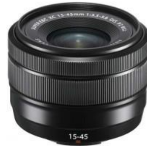
Lensa XC 15-45mm