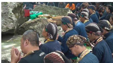
Gambar 12 Tangkapan Layar Cuplikan Gambar Prosesi Doa Saat Melabuhkan Rangkaian Sesaji Labuhan Merapi

agar sebisa mungkin dapat bercerita atau memberikan makna. Kemudian pada chapter ini, perlu pada implemntasinya, diperlukan memperhatikan teknik penciptaan suasana. Dikarenakan pada babak ini akan lebih banyak original sound , maka visual atau gambar yang diambil dikombinasikan menggunakan gaya observational untuk menunjukkan sisi kenaturalan subjek maupun objek yang akan di ekspos. Sehingga pada bagian ini perencanaan diawal yang dimana akan mengekspos detail para pejuang tradisi Labuhan Merapi secara garis besar dapat terbilang telah berhasil di implementasikan