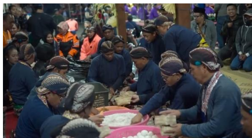
Gambar 7 Tangkapan Layar Cuplikan Gambar Para Abdi Dalem