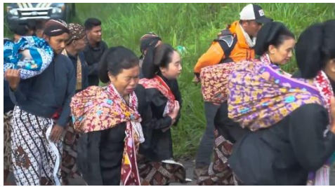
Gambar 10 Tangkapan Layar Cuplikan Gambar Para Pejuang Pelestari Di Proses Tradisi Labuhan Merapi