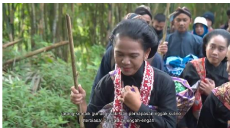
Gambar 11 Tangkapan Layar Cuplikan Gambar Pejuang Wanita Dalam Proses Tahlilan Labuhan Merapi