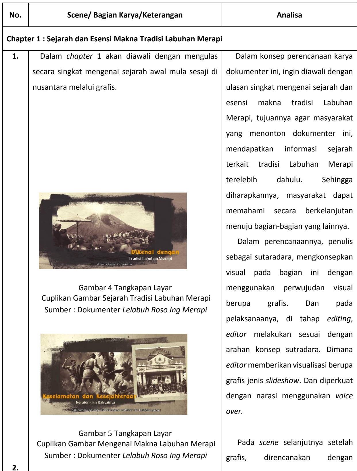
Tabel 1. Analisis Karya