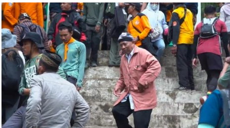
Gambar 17 Tangkapan Layar Cuplikan Gambar Masyarakat yang Telah Selesai Menyaksikan Prosesi Tradisi Labuhan Merapi

Dimana narasinya akan memuat sebuah kesimpulan bahwa, keyakinan diri sendiri yang kuat terhadap nilai-nilai luhur yang diyakini merupakan nguri-uri yang sesungguhnya. Dan sesaji hanyalah sebuah simbol dari segala bentuk doa dan harapan serta nilai-nilai luhur yang ditanamkan di dalam diri, yang kemudian dijadikan pedoman hidup dalam bermasyarakat.